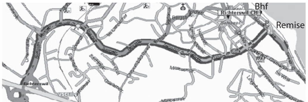
A3 Zürich <----> Chur

Die Remise befindet sich auf der Seite des Richterswiler Seebades, erreichbar nur zu Fuss, entweder vom Seebad Parkplatz aus (am Ende des